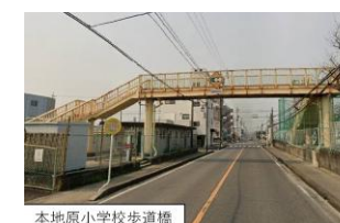
本地原小学校歩道橋