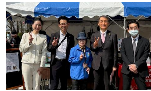
さくらまつりの会場にて

市の新年度テーマ「楽しく健やかな暮らし」 3月議会の報告をします。市長の今年度のテーマは、「楽しさ」をプラス。 夏には市民プールがいよいよ生まれ変わり、秋の市民祭も盛大に森林公園で行われます。また、中日ドラゴンズのファーム拠点の誘致に関する検討も開始されます。 微力ですが、尾張旭市を少しでも楽しく健やかに暮らせるよう職責を果たします。ご支援ください。