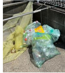
回収されないプラスチックごみ