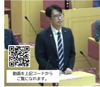
動画を上記コードからご覧いただけます。