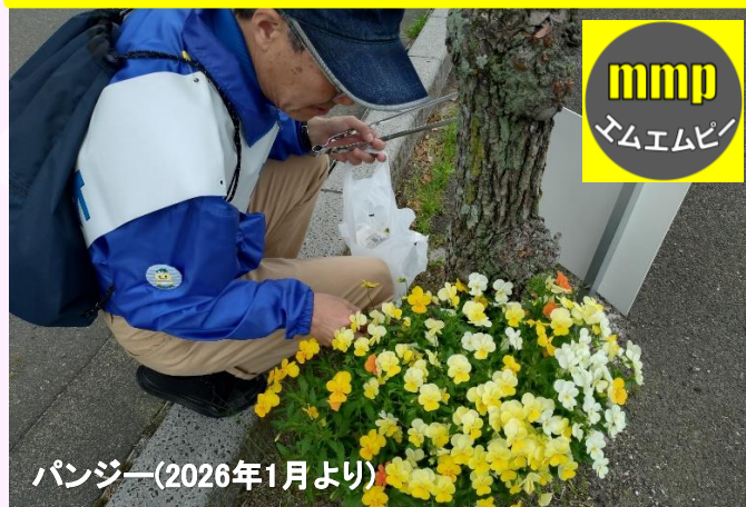
パンジー(2026年1月より)

アダプトプログラムmmp(エムエムピー:団体名)は、 日曜日午前8時からの“ごみ拾い”とともに “花を育てる活動”を行っています