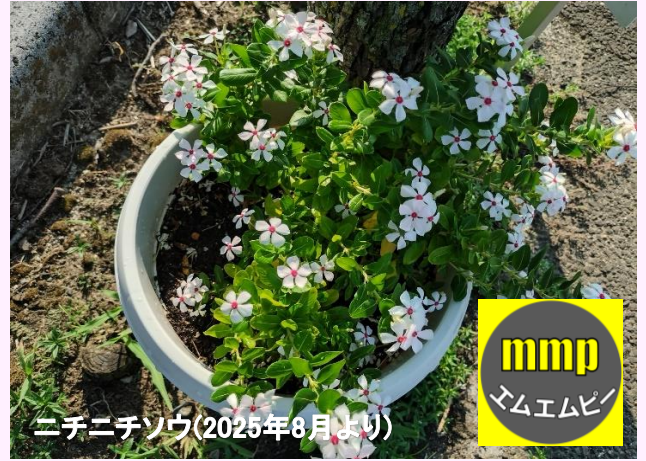
ニチニチソウ(2025年8月より)