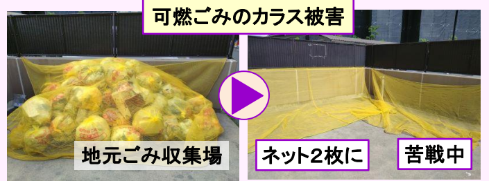
可燃ごみのカラス被害