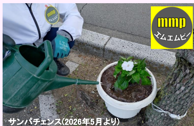
サンパチェンス(2026年5月より)

アダプトプログラムmmp(エムエムピー:団体名)は、 日曜日午前8時からの“ごみ拾い”とともに “花を育てる活動”を行っています