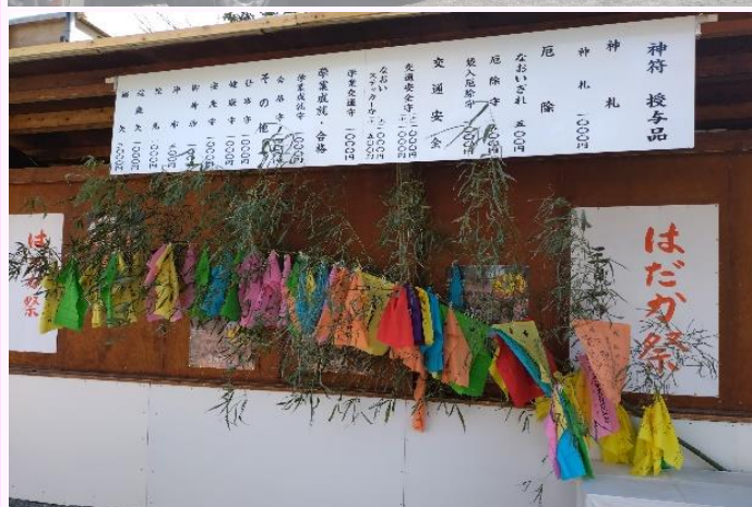
はだか祭り 儼追笹