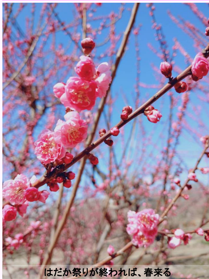
はだか祭りが終われば、春来る