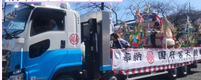
はだか祭り 大鏡餅奉納