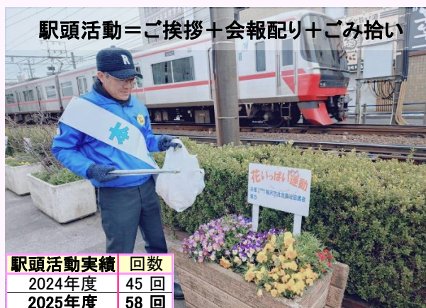
駅頭活動＝ご挨拶＋会報配り＋ごみ拾い