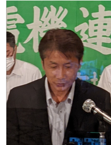
活動方針提案 押日副議長