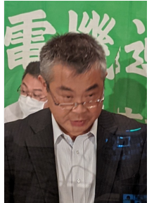
規約規程提案 本村副議長