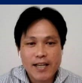
野原前会計監査人