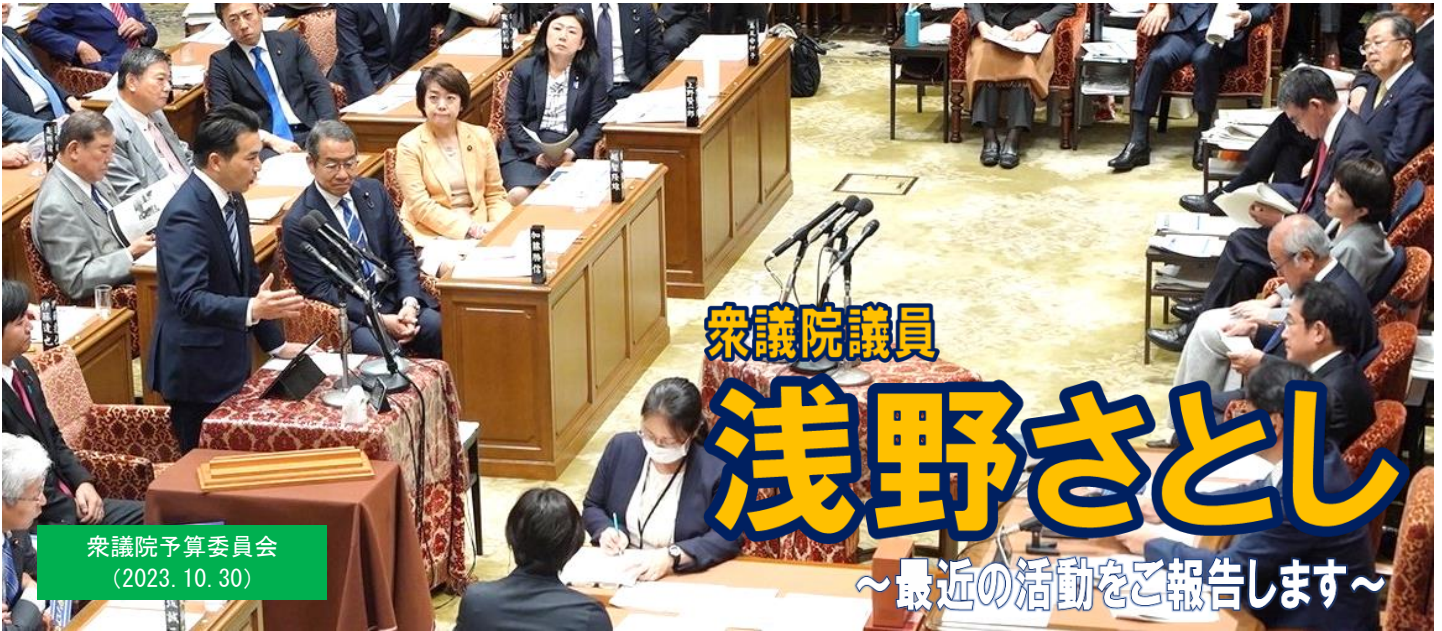
衆議院予算委員会 (2023. 10. 30)