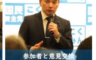
参加者と意見交換