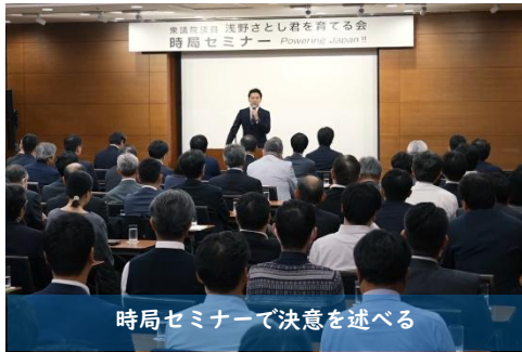
時局セミナーで決意を述べる