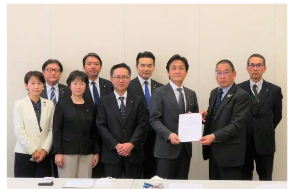
国民民主党と無所属議員による 全建総連議員懇話会 設立総会の様子

また、政府与党内では令和3年度の税制改正の議論が始まりました。私は国民民主党の税制調査会副会長として、各業界団体の皆様からのご要請をしっかりと届けます！