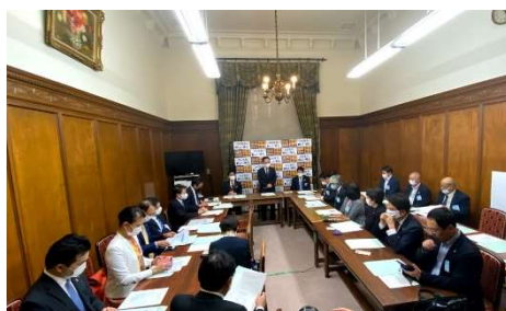
国民民主党行政書士制度推進議連 設立総会の様子