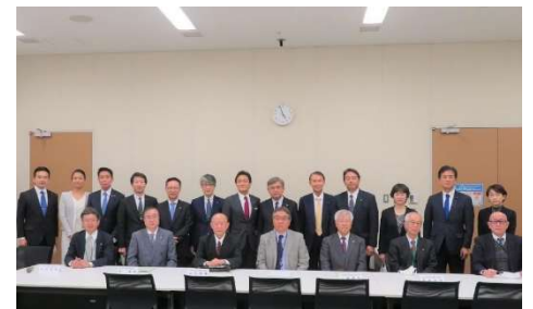
国民民主党税理士制度推進議連 設立総会の様子