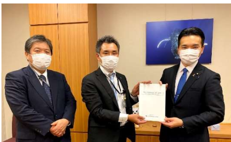
生保労連より税制改正要望を いただきました