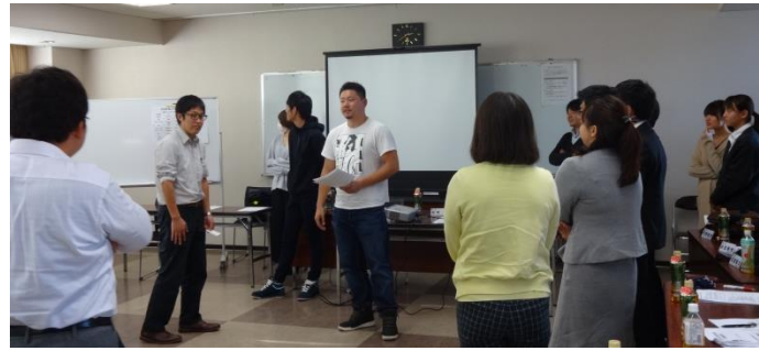
第1回青年女性委員会の様子