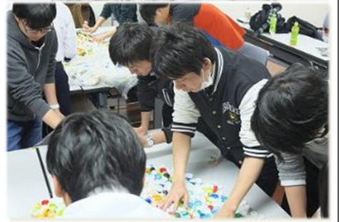
エコキャップボランティア活動を行っています。