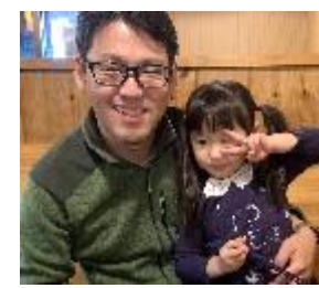
太陽誘電労働組合

今年は「丑年(うしどし)」です。 丑年は「我慢(耐える)」や「発展の前触れ(芽が出る)」を表す年になると言われています さて、丑年生まれのみなさん23名の今年の抱負をご紹介します。