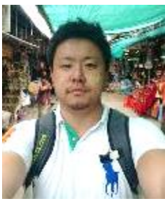
アドバンテスト労働組合

明けましておめでとうございます。 今年の抱負は、食生活の改善!! なぜかと言うと、去年の健康診断の結果が初めて基準値を超えてしまったからです。気持ちはいつまでも若いつもりですが、体はそうではないので改善できる様に、日々意識して生活を送れるように頑張りたいです。