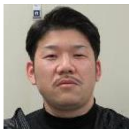
モメンティブ労働組合

新年あけましておめでとうございます。 withコロナ時代にニューノーマルなプレイスタイルでゴルフを初めてみました。 中々上達しませんが、攻めの気持ちを忘れず、レベルアップして今年中に100は切りたいと思います。