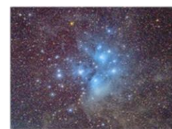
☆工藤さん撮影の天体写真☆

新年あけましておめでとうございます。 今年で5回目の「年男」を迎えます。牛のごとくどっしりとじっくりと過ごしたいと思っています。 趣味は天体撮影と画像処理です。掲載の写真はスバル星団です。