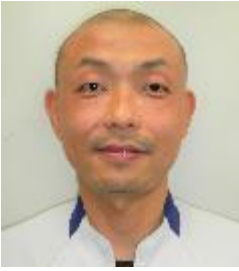
パナソニック AP空調冷設機器 労働組合

新年あけましておめでとうございます。 年男の節目に心機一転、鈍り切った筋肉に活を入れる一年にしようと思ひます！ コロナ禍はまだしばらく続きそうですが、ウシのようにどっしり構えて、力強く1年を過ごしていきたいと思います。