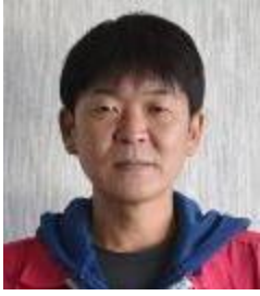
ルネサスグループ労働組合連合会

家を建ててから1年が経ちました。毎日キレイに保とうと思ひているのですが、散らかって、放置して、片付けてを繰り返しています。今年は家も仕事のタスクも行きたい旅行先も常にキレイに片付けられるよう頑張ります。