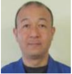
東京パーツ工業 労働組合

あけましておめでとうございます。 2020年はコロナウイルスの影響で色々大変な時期を過ごしました。 2021年はコロナウイルスを吹き飛ばすぐらい明るく、元気に仕事やプライベートを充実させたいです。