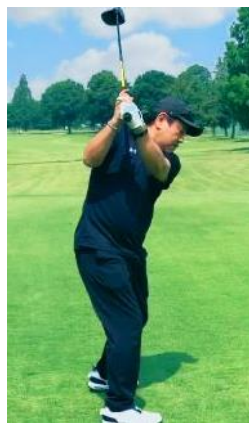
パナソニック アプライアンス労働組合

新年あけましておめでとうございます。 昨年は休日家にいることが多く、今まで以上に運動不足となってしまいました。今年は筋トレや運動を習慣化し、怪我や病気もなく健康的に過ごせるようにしたいと思います。