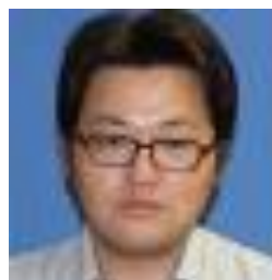
パナソニック内装建材労働組合

新年、あけましておめでとうございます。 今年は健康面に気を付けて過ごしていければと思っています。また、「新しい生活様式」の中で、何か趣味を見つけて充実した1年にしたいと思います。