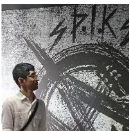
イチカワ労働組合

今年は、任された仕事により一層の責任感を持って携わり、現在の自分に求められている業務をこなす多くの実績・結果を残せる年にしたいと思います。