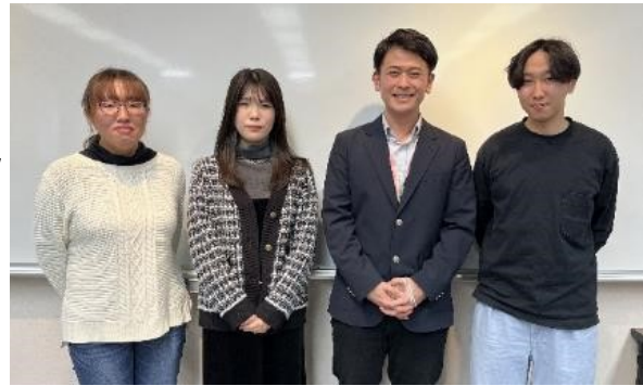
第56期青年女性委員会 2役

これまでと同様に充実した活動が出来るよう、職場の皆様のご理解とご配慮をよろしく願いいたします。