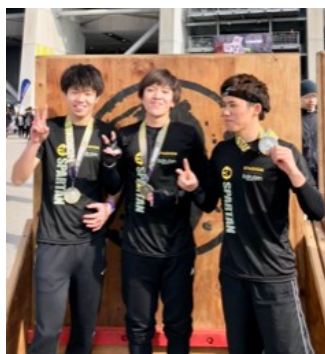
(向かって右側が越田さん)