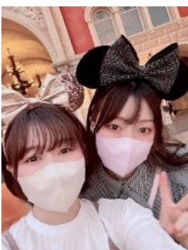
(向かって左側が夢胡さん)

新年、あけましておめでとうございます。 今年の抱負は推し活を頑張ることです。コロナ禍でハマったハロプロに去年から本格的に推し活を始めました。今年も体調等に気を付けながら推し活していけたらと思います。