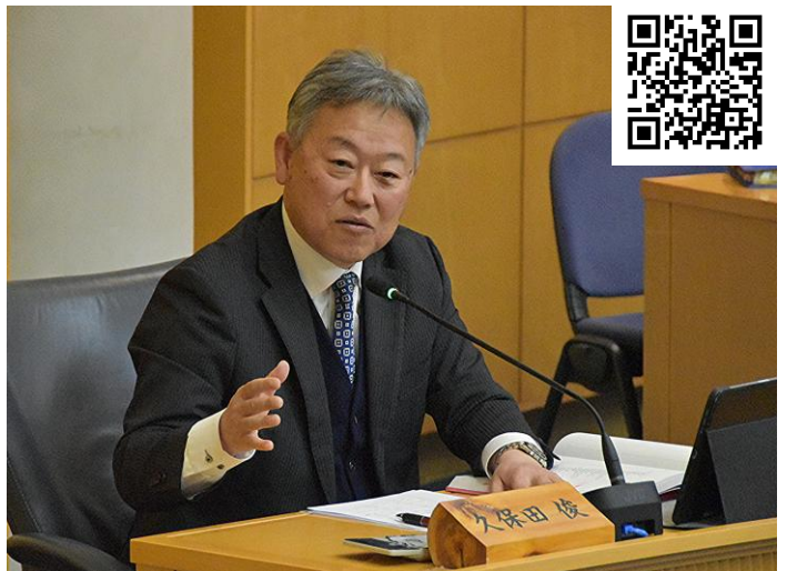
R8年度予算特別委員会での質疑