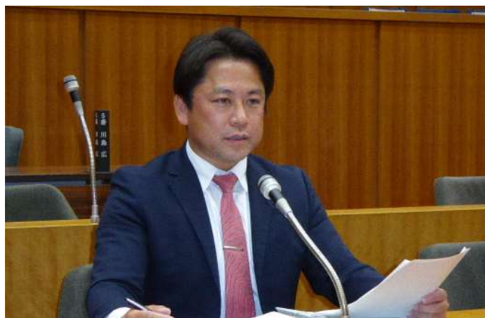
全ての議案をチェックし、賛否を表明しました。