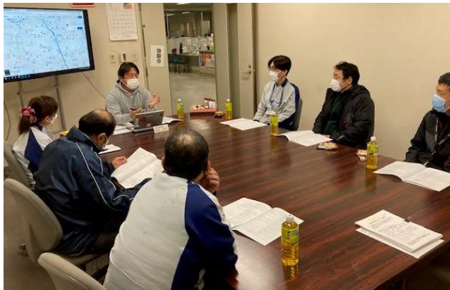
参加者の皆さんと意見交換！

他にも、「マイナンバーカード関連」、「外国籍住民との共生について」など、様々なご意見、ご要望がありました。