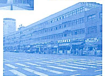
【龍山電子商街近景】