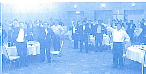
【最後は団結！ガンパロー！！】