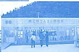
さんさん商店街の様子