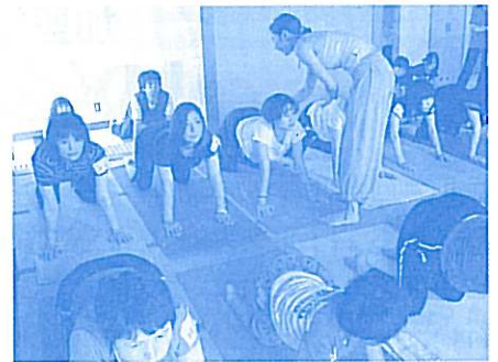
まだまだ余裕うう…

http://www.jeu.jp/higashiou/katsudou/2012071300007/