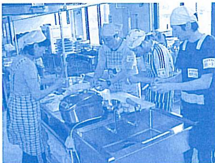
普段から料理はしています!?