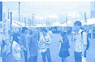
美味しそうな匂いについ...

がれき処理は一段落ついていましたが、本当の復旧・復興は未だ道半ばであり、私達も息の長い支援の必要性を感じ、帰途につきました。