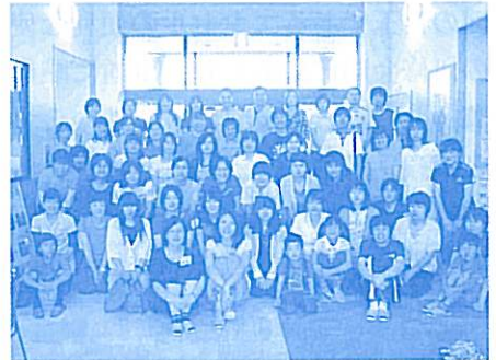
最後は全員でパチリ