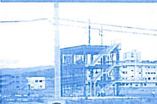
南三陸町の防災センター

東日本大震災からの復興の一助になればとの思いから、2012年6月24日(日)、加盟組合より33名の参加を得て南三陸町の復興市とさんさん商店街を訪問しました。少し肌寒い空模様でしたが、商店街を運営されている皆さんの元気な笑顔に心が温くなる思いを感じました。さんさん商店街では震災当時の体験を語られる語り部さんから貴重なお話をお聞きし、震災の傷跡の大きさを改めて思い知らされました。