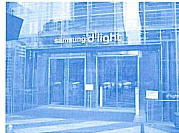
【サムスン広報館入口】