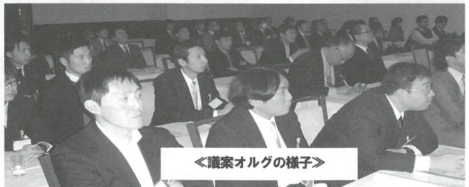
《議案オルグの様子》