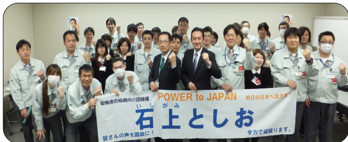
三洋労組エナジー連合支部徳島支部 会議室