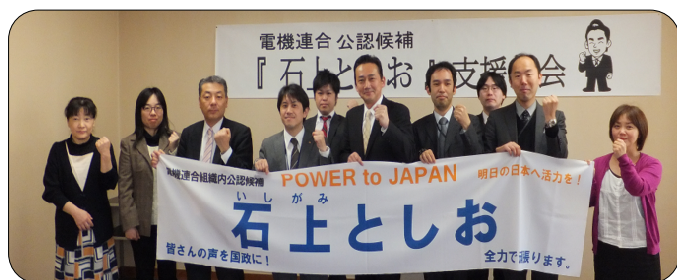
ルポールさぬき(香川県高松市)