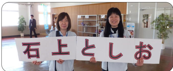
パナソニック ヘルスケア労組脇町支部 食堂