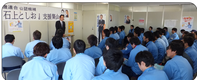
三菱電機労組丸亀支部 会議室