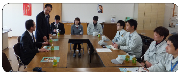
パナソニック エコソリューションズ内装建材労組 会議室