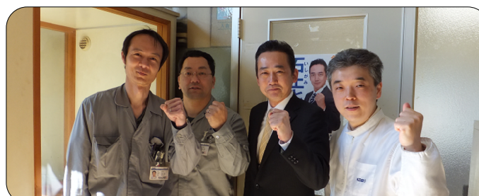
大真空労組徳島支部 事務所