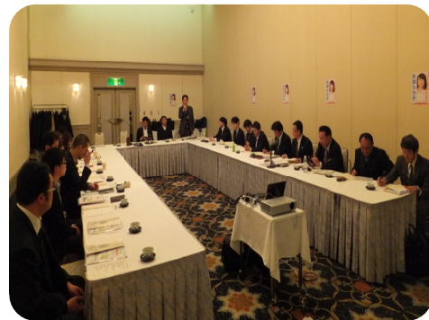
(東) 福祉共済加入促進担当者会議 (2015年12月19日(土))