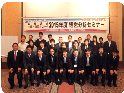
中国・四国ブロック経営分析セミナー (2016年2月26日(金)～27日(土))