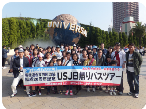
(東) 結成20周年記念 日帰りバスツアー (2015年10月24日(土))