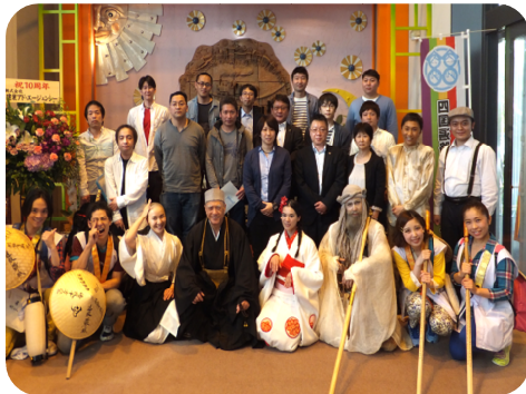
四国ブロックコースセミナー (2016年4月22日(金)～23日(土))