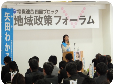
四国ブロック地域政策フォーラム (2016年4月9日(土))