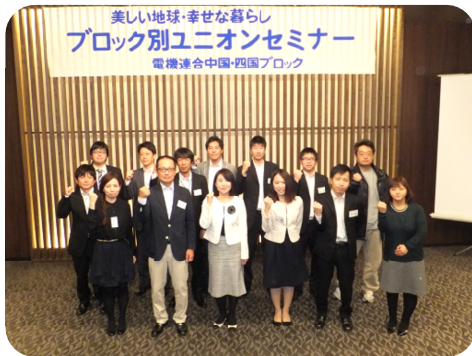
中国・四国ブロックユニオンセミナー (2015年10月30日(金)～31日(土))