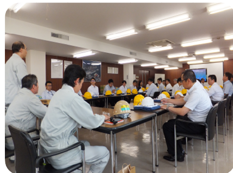
第24回四国電機産業労使懇談会 (2016年5月27日(金))