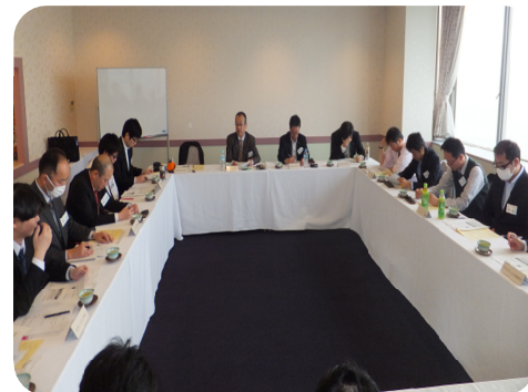
四国ブロック中堅・中小労組連絡会議 (2016年3月19日(土))