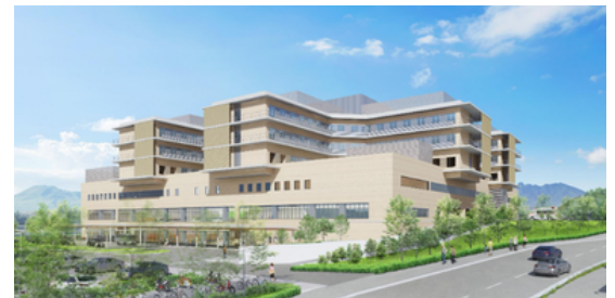
↑新病院イメージ図

三田市の負担分ですが、整備費は国の交付金増により減少していますが、利息の利率が上昇しているため全体としては微増となっております。三田市の救急医療を含む中核病院として、必要になると考えており、引き続き動向に関して注視してまいります。