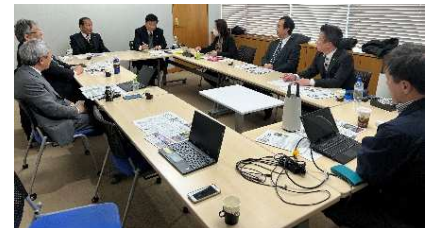
＜取り組みを共有しました＞