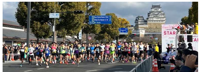
＜ゴールを目指し一斉にスタート＞