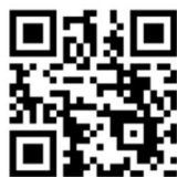
<ひめまっぷQRコード>