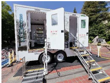
<災害用トイレトレーラー>

トイレトレーラーは、けん引車さえあればどこにでも移動ができ、到着後すぐに使用することが可能です。