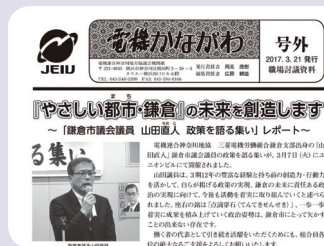
機関紙『電機かながわ』 第110号、第111号、第112号発行 鎌倉市議会議員選挙 号外発行