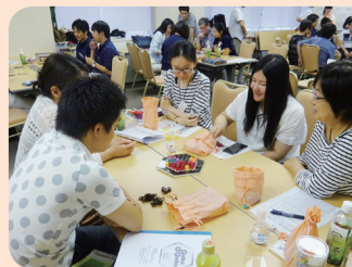
『ボードゲーム交流会』 2017年6月24日 参加者数 24名