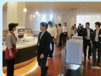
『食堂見学会』 2017年5月24日 参加者数 38名