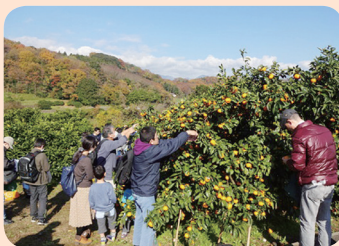
『みかん狩り』 2016年12月3日～4日 参加者数 2,700名