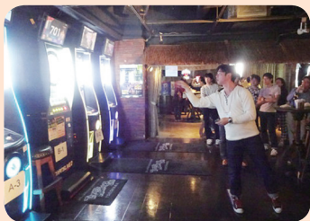
『ダーツ大会』 2016年11月6日 参加者数 64名