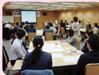
『ニューリーダーセミナー』 2017年4月27日 参加者数 42名