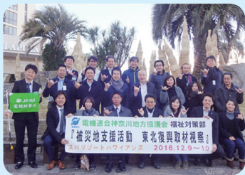
『東北復興取材視察』 2016年12月9日～10日 参加者数 22名