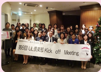
『UL(ユニオンレディ)倶楽部』 第6回 2016年11月9日 参加者数 33名 第7回 2017年6月22日 参加者数 22名