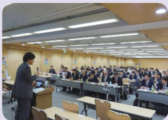
『春闘討論集会』 2017年3月7日 参加者数 115名