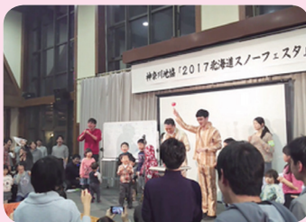
『北海道スノーフェスタ』 2017年1月28日～1月30日 参加者数 331名