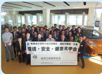
『環境・安全・健康見学会』 2017年1月24日 参加者数 31名