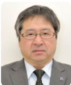
電機連合神奈川地協 議長