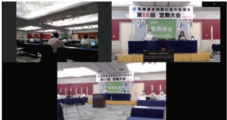
中継会場の様子 (Zoom 配信画面)