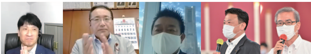
組織内議員団「いちよう会」(オンライン参加含む)