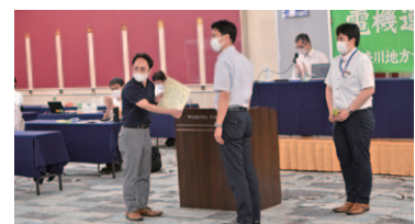
ディッシュペーパーデザインコンテスト表彰式