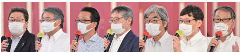
特別常任幹事・特別幹事