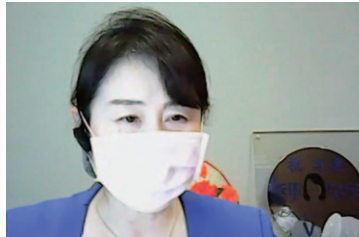
電機連合政治顧問 矢田参議院議員 (オンライン)