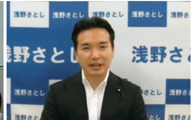
電機連合政治顧問 浅野参議院議員 (オンライン)