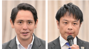
国民民主党 神奈川県第19区 深作総支部長