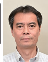
こくみん共済 coop 神奈川推進本部 本部長