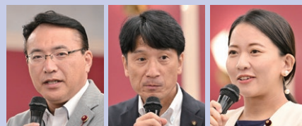
森 会長 相模原市議会議員