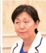
立憲民主党 神奈川県連 水野参議院議員