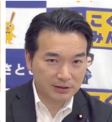
電機連合政治顧問 浅野衆議院議員 (ビデオメッセージ)