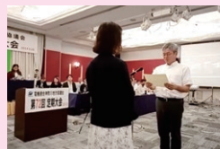
障がい福祉委員会・ティッシュペーパーデザインコンテスト表彰