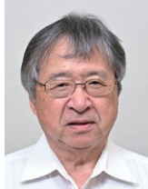
電機神奈川福祉 センター理事長