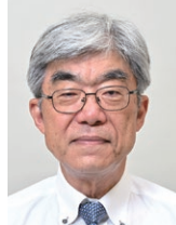
電機神奈川福祉 センター理事