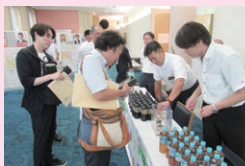
障がい福祉委員会・ドリンクカンパ