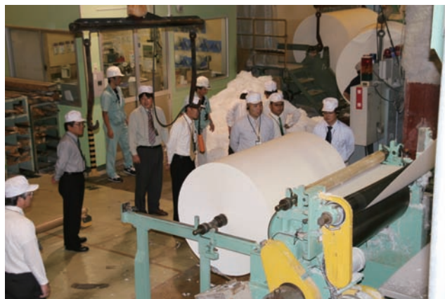
↑ 再生されたパルプが、薄くのばされローラーに巻きついていく