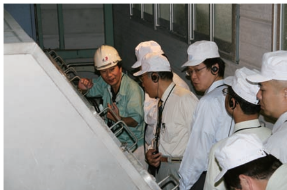
↑ 溶かした牛乳パックを泡によってインクや灰分などを除去するシステムについて説明を受ける

障害福祉委員会では、カンパ活動に使っている、ティッシュペーパーの工場見学をしてきました。牛乳パック100%再生紙からティッシュペーパーを作り出せる工場は、全国でも4事業所しかなく、環境問題について改めて考える機会となりました。