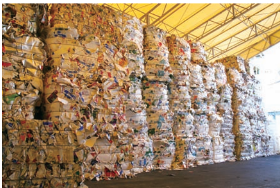
↑ 山のように積まれた牛乳パック

障害福祉委員会では、カンパ活動に使っている、ティッシュペーパーの工場見学をしてきました。牛乳パック100%再生紙からティッシュペーパーを作り出せる工場は、全国でも4事業所しかなく、環境問題について改めて考える機会となりました。