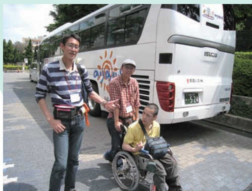
沖縄県議会のご協力により、敷地内に大型バスの 駐車、及びトイレを使用させていただきました。

今回のツアーは、車椅子で入り込むこ との出来ない場所も多く、ボランティ アさんの体力頼みのふれ愛の旅でした。