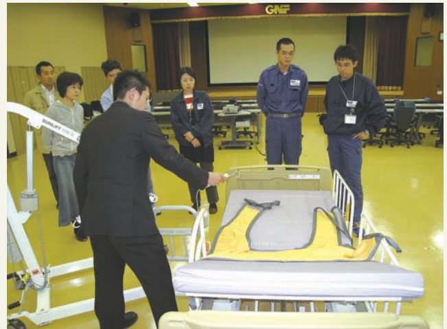
ニュークリア・フュエル・ユニオンにて