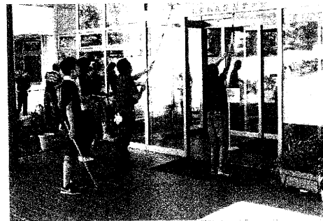
(写真:下)社会福祉施設の環境美化の様子