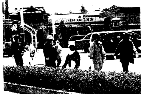
(写真:上)空き缶拾いの様子