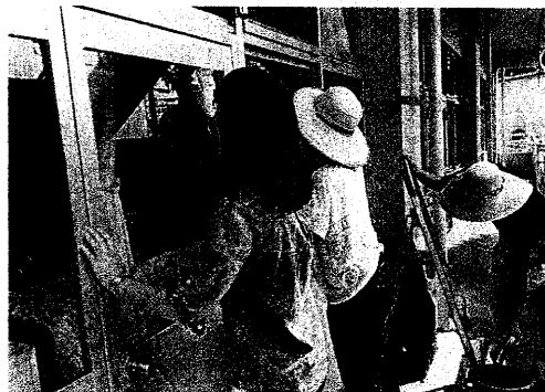
飯田荘でのボランティア活動

参加者は、桐林のオムロン飯田駐車場で開会式の後、各福祉施設に移動。東栄町の飯田荘では、庭の草取りと施設外側の窓拭きに汗を流した。施設によっては、扇風機の掃除や蛍光灯の清掃・交換、車椅子の掃除、換気扇の清掃、エアコン・フィルター掃除などを行ったところもあった。