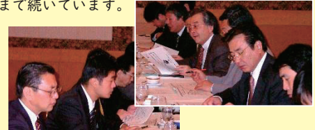
民主党との政策協議(2004年)

政党とも、1996年から民主党(現・国民民主党)、自民党、2003年から公明党とスタートし、現在まで続いています。