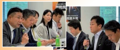
国民民主党との政策協議(2023年)

2023年は6~9月にかけて実施しました。そして、今年からは、デジタル庁との政策協議を始めます。