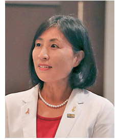
国民民主党愛媛県連 石井代表