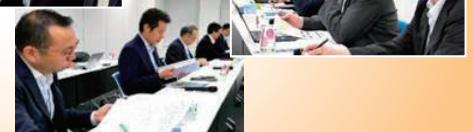
経済産業省との政策協議(2023年)