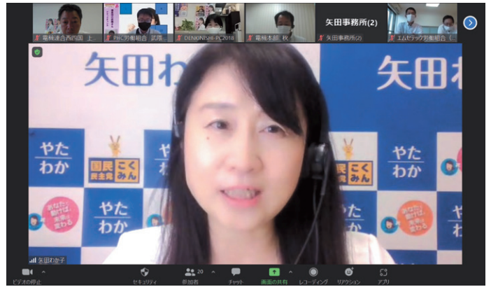
参議院議員 矢田わか子氏