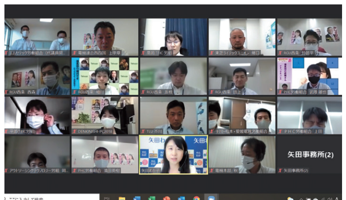
頑張れ矢田わか子議員！