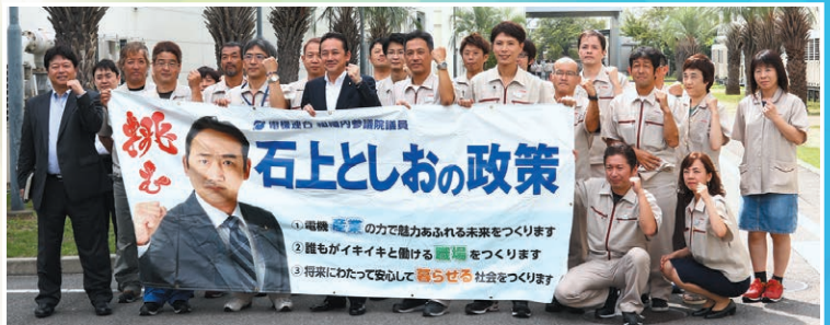
東芝ライテックユニオン 今治支部