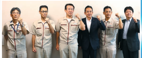
東芝ライテック(株) 今治事業所