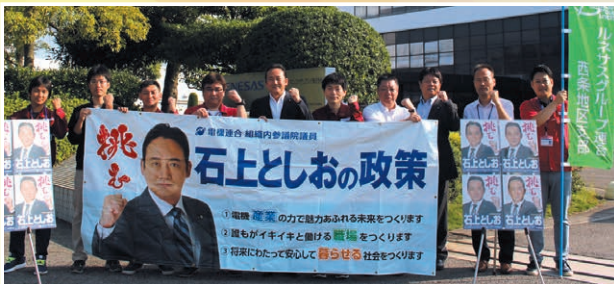
ルネサスグループ連合 西条地区支部 アウトソーシングテクノロジー労組