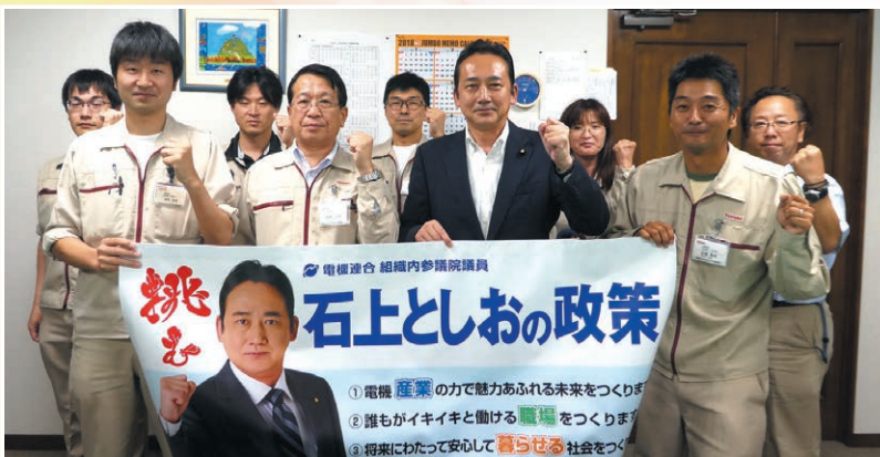
東芝E-コントロールシステム労組 本部・四国支部 東芝E-コントロールシステム(株) 四国事業所