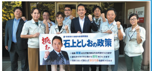
三菱電機ライフサービス(株) 西条支店