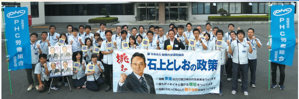
PHC労組 四国支部(松山) PHCマニファクチャリング労組