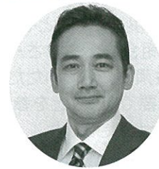
電機連合政治顧問 参議院議員 石上 俊雄