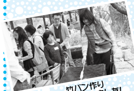
竹パン作り おいしくできました!