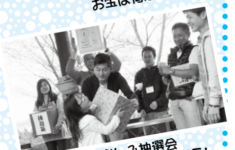
お楽しみ抽選会 一等賞品 重そう!