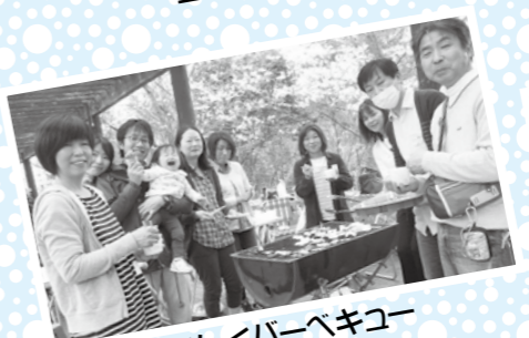
楽しくバーベキュー