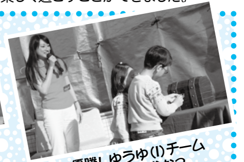
優勝! ゆうゆ(1)チーム お宝は何かな?