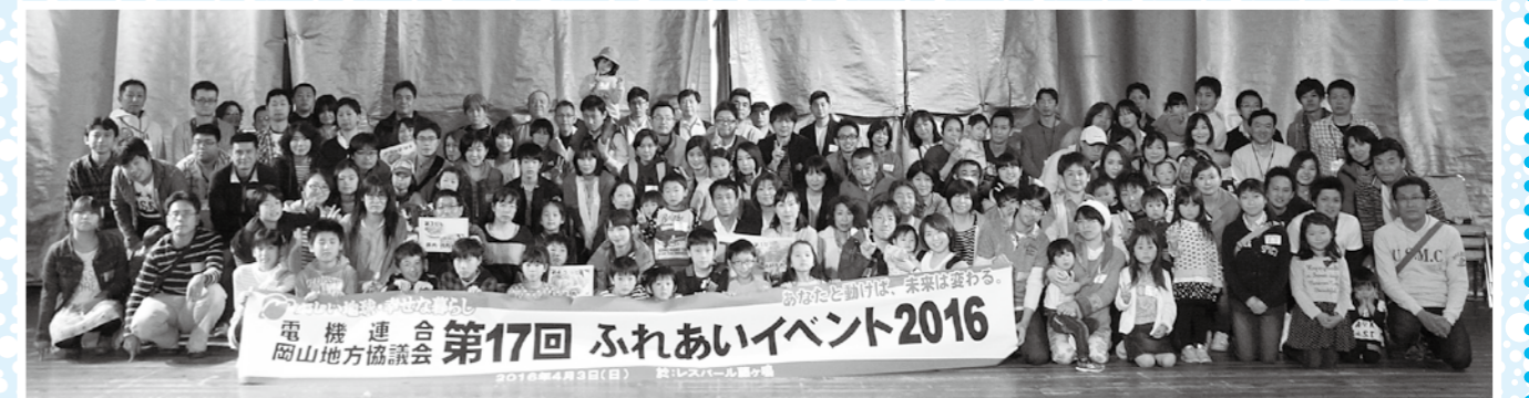
電機連合 第17回 ふれあいイベント2016