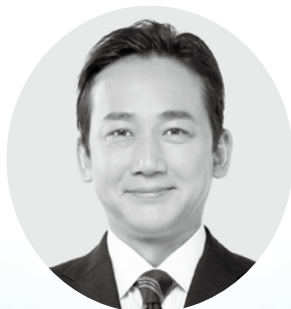
電機連合政治顧問 参議院議員 石上 俊雄