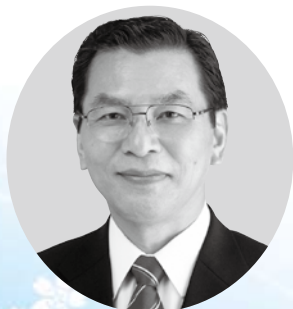
電機連合政治顧問 衆議院議員 大島 章宏