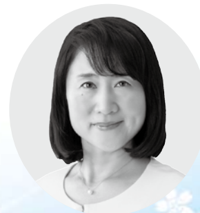
電機連合政治顧問 参議院議員 矢田 わか子