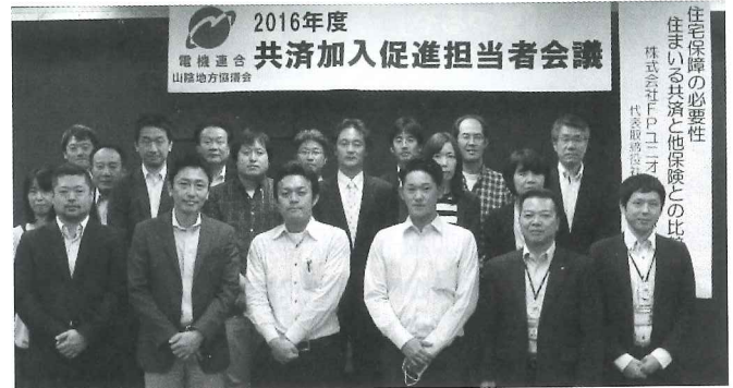
▲鳥取市開催：参加者のみなさん