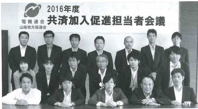
▲松江市開催：参加者のみなさん