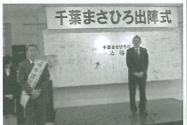
中原議長の激励あいさつ

栃木市議選は、合併 などから、大変難しい、初めて栃木市全域 かつ厳しい選挙となつた。合併自体は、結果は、前回の得票に555票の上積みを図り、2620票、第5位という立派な成績で当選をさせていただきました。感謝の気持ちでいっぱい