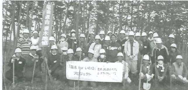
ボランティア活動に参加した福祉対策部の皆様

5月10日(土)、福島県いわき市にて福祉対策部主催の「東日本大震災復興ボランティア活動」を行いました。今回体験した内容を、各単組の社会貢献活動に役立てることも含め支援活動を行ってまいります。