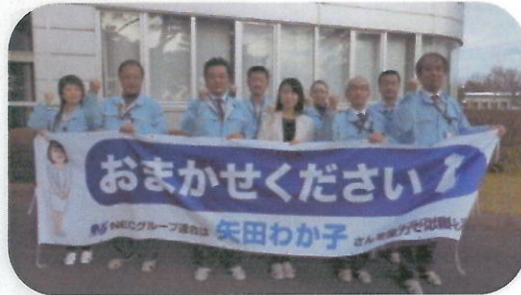
NECネットワークプロダクツ労働組合 那須塩原地区本部