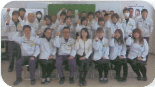
第一電子工業労働組合