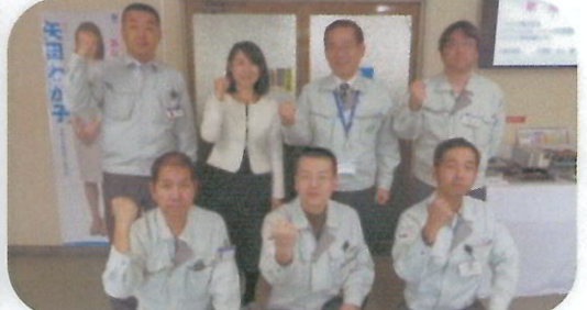
テクノデバイス労働組合