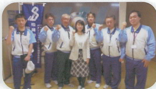
松井松山労働組合