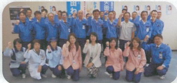
富士通テン労働組合小山分会