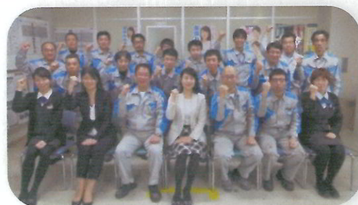
ケイミュー労働組合足利支部