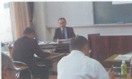
経営分析講座の様子