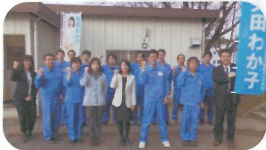
富士電機労働組合大田原支部