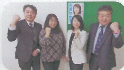
電機連合栃木地協