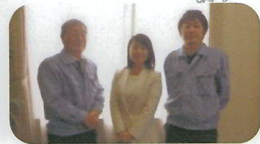
富士合成労働組合