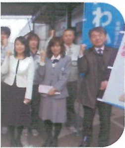
フィアンス労働組合 地区支部