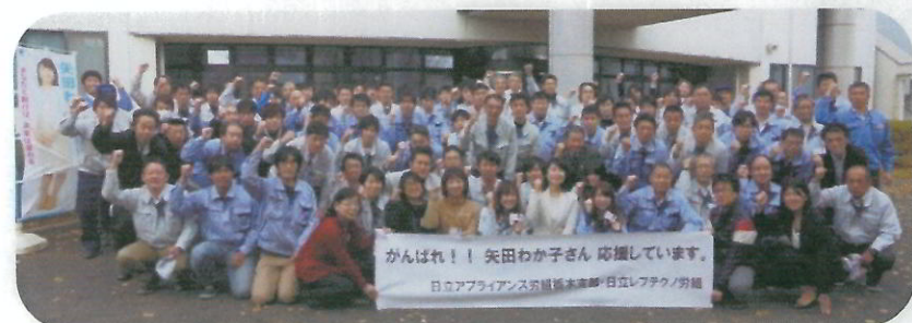
日立アプライアンス労働組合栃木支部 & 日立レフテクノ労働組合