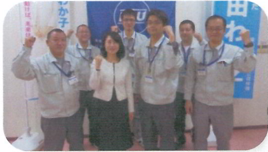
パナソニックデバイスタイコー労働組合