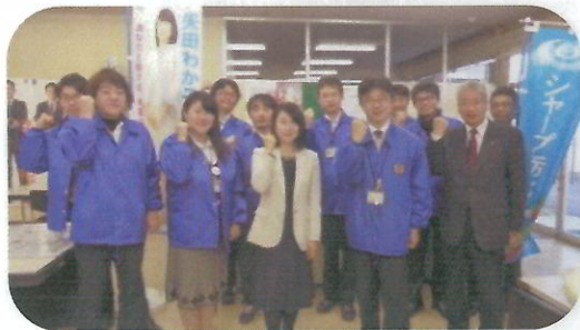
シャープ労働組合栃木支部