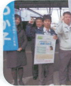
パナソニックア 宇都