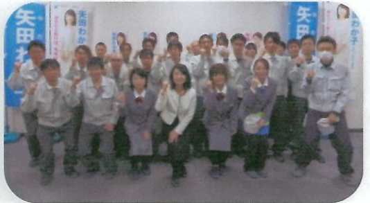
パナソニックエコソリューションズ住宅設備労働組合