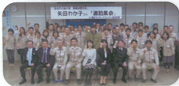
東芝ライテックユニオン鹿沼支部