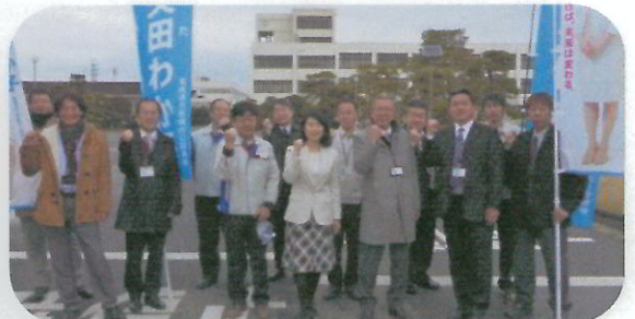
富士通労働組合小山支部 & 富士化成労働組合小山分会