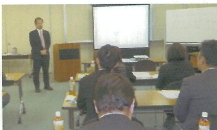
ライフアップセミナーの様子

12月18日(金)、「ライフアップセミナー」を開催しました。今回は「外資系損保の盲点について」や「自然災害に対する個人としての備えについて」講演をいただきました。可処分所得の向上に向け、保険の仕組みの理解が深まりました。