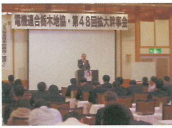
第48回 拡大幹事会の様子

この拡大幹事会では全国各地で開催されており、最も歴史と権威ある行事となっております。先駆者たちの熱い想いが込められた会に参加し、新しいことへの挑戦心を新たにしたいとこ