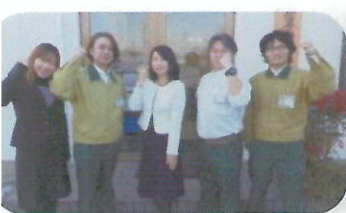
日本信号労働組合宇都宮支部