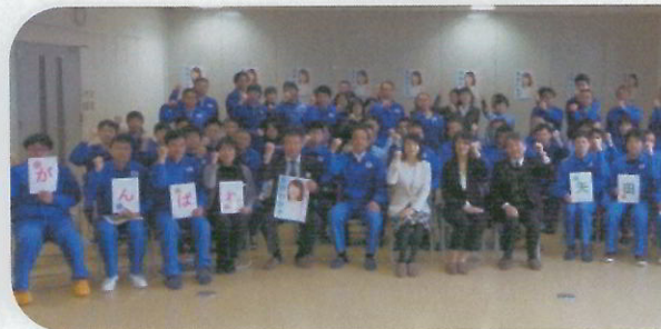
東光高岳労働組合小山支部