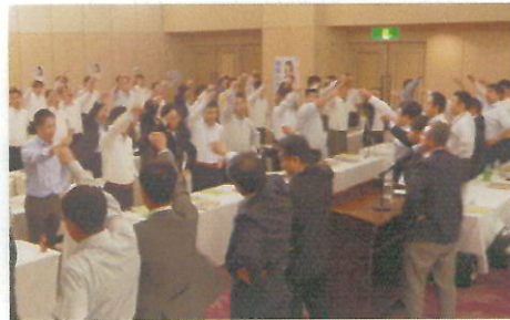
ガンパロー三唱で更なる飛躍・発展を誓い合う出席者