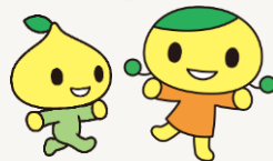
公式キャラクタービットくん(左)とビットネネ(右)